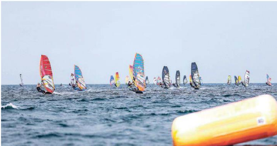
Auch die Windsurfelite kam nach Schönberg, um im Rahmen der BBD noch einmal zu punkten