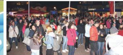
Gute Stimmung beim abwechslungsreichen Bühnenprogramm an der Seebücke