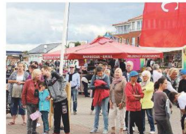
Die Baltic Beach Days waren ein Publikumsmagnet

SCHÖNBERGER STRAND (ja) Bei den BBD zeigte sich Schönberg von seiner besten Seite. Mit sportlicher Windsurf-Action, einem bunten Rahmenprogramm für Jung und Alt und mit jeder Menge Unterhaltung boten die BBD alles, was das Festival-Herz begehrt. Neben den Wettkämpfen der Windsurfer stand vor allem das Bühnenprogramm und die Kindermeile im Vordergrund der Veranstaltung. Konkrete Auswertungen über den Erfolg der diesjährigen Veranstaltung gibt es noch nicht. Aber der Plan, das Konzept für 2017 mit den Gemeindevertretern zu besprechen, steht bereits.