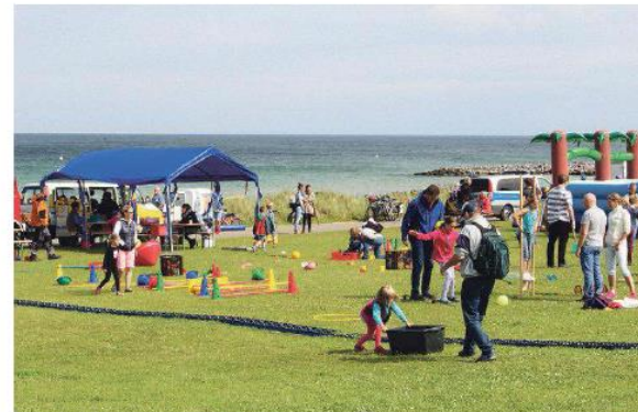
Dauerhaft gut besucht: Die Kinder-Spiel-Meile bei den BBD

Besucher trotzten dem Wetter und genossen vier Tage lang das tolle Festival